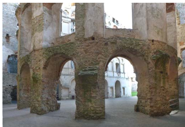
Fig.3. The main building – brick vaults in the "passage" surrounding the elliptical castle courtyard, which are still waiting to be reconstructed.

Waiting for binding and concrete decisions to be made, in 2013, the author addressed the most influential persons in Poland 12 with an open letter entitled "On the future of Krzyżtopór Castle in Ujazd" [12]. In this letter, a brief description of the pre-and post-war fortunes of the castle and a presentation of some possibilities of its reconstruction as well as arguments justifying this need were followed by an appeal to support this idea through their patronage and authority. The paper entitled "Doctrine or life...", prepared for the 2012 ICOMOS Conference (Krakow), was annexed to this letter.