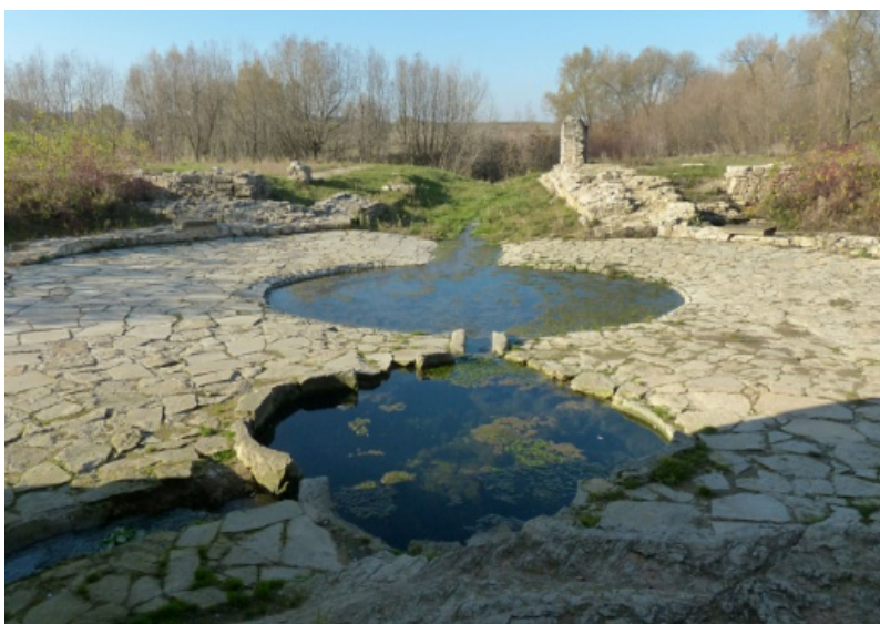
Fig. 4. Elements of the small architecture of the garden and the water intake in front of the rampart of the 8-sided tower (uncovered in the course of archaeological excavations)

In the next part of his letter, the author confused Opaliński with Ossoliński (!), diminished the role of the research and reconstruction works that had been carried out under the supervision of Professor Alfred Majewski and suggested that the reconstruction of the castle, i.e. “liquidation of the ruins”, would evidently falsify the foregoing historical evidence... He finished by asking a shocking question, namely if the conservation of historical monuments was supposed to accept their falsification or rather preserve their authenticity, regardless of their current condition. To sum up, a representative of the government regarded starting the debate on changing the doctrine behind the conservation and restoration of monuments and sites as inappropriate.