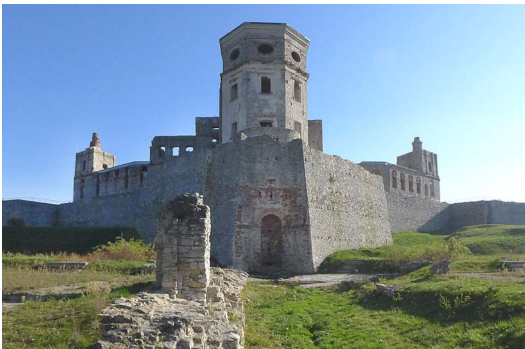
Fig. 9. The north elevation of the castle with uncovered architectural elements of the former garden

Ryc. 8. Widok zamku od północnego-zachodu.