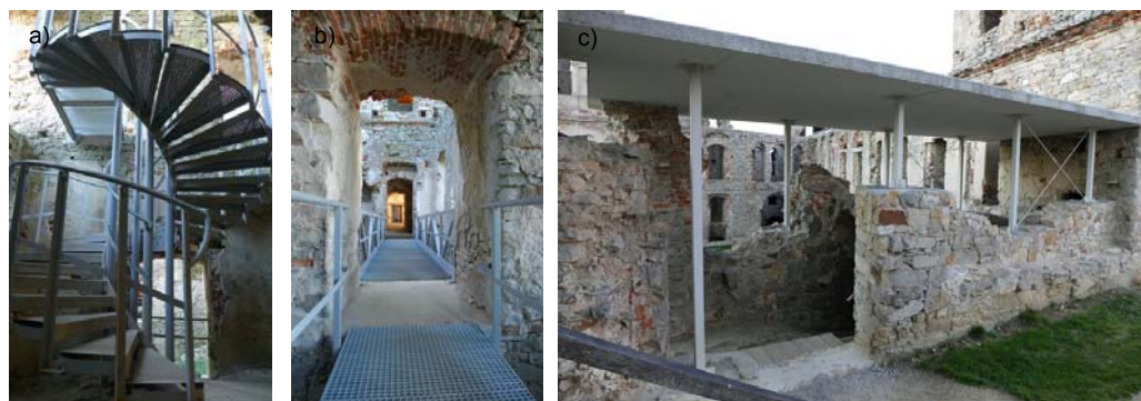
Fig. 1. Examples of new forms and materials which were introduced into the castle: a) vertical communication – steel stairs, b) a steel ramp in the interiors where the vaults have not been renovated, c) an RC canopy over the ramp next to the tower