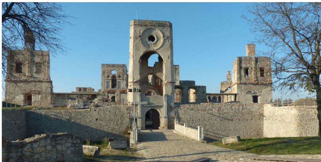
Fig. 7. The front (southern) elevation of the castle. Ryc. 7. Elewacja frontowa (południowa zamku).

In order to implement this optimistic vision, it is necessary to: