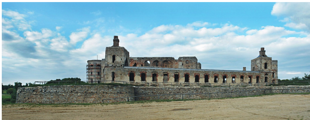
Fig.5. Southern view of the castle – in the foreground, the left wing with the new roof with a minimum pitch, which replaced the high-pitched roof from the 1970s. The final result is grotesque – it optically reduces the height of the wing, at the same time hampering the run-off of water from the roof slope. This photograph shows that the restoration of the high-pitched roofs, in accordance with the reconstruction project, would emphasise the monumental character of the building

Ryc. 5. Widok zamku od południa – na pierwszym planie lewe skrzydło z nowymi dachem o minimalnym nachyleniu połaci, wprowadzonym w miejsce stromego dachu z lat 70. XX w. Finalny efekt jest karykaturalny – obniża optycznie wysokość skrzydła, jednocześnie utrudniając odwodnienie połaci. Ilustracja ta unocznia, że przywrócenie odtworzonych już w projekcie konserwatorskim dachów stromych, podkreśliłoby monumentalność bryły zamku