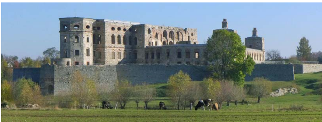
Fig.8. A view of the castle from the north-west (photograph by the author, 2016).

Thus, the only issue to be considered by specialists is if the application for inclusion should be submitted right now, or maybe when the structural members and decorative elements whose forms and material structure are known have been recreated.