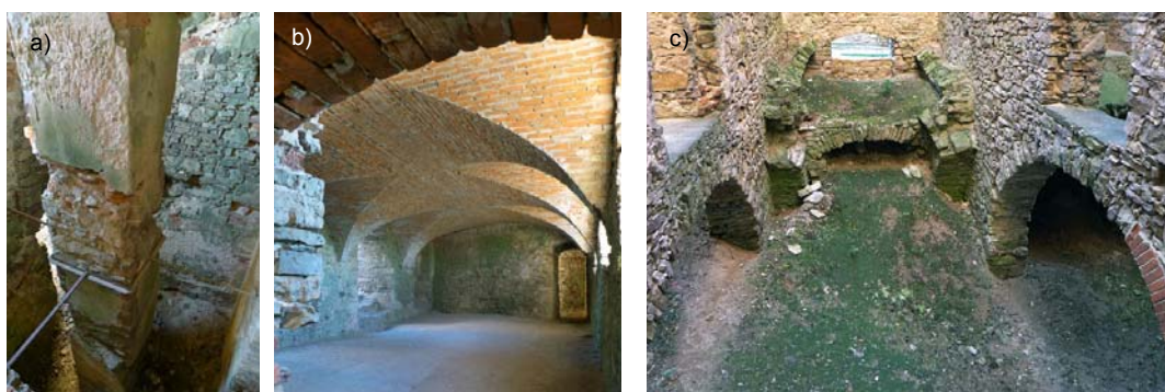
Fig. 2. Examples of different conservation activities: a) the "stabilisation" of the load-bearing pillar of the four-flight stairs with steel reinforcement without any stairs casing, b) the vaults in the west wing of the castle reconstructed in accordance with the author's design, c) the cellars under the main body of the castle from which rubble has not been removed

At present, the assessment of what has been done (and what is not being done) is not simple and straightforward. On the one hand, it is good that some elements of the castle's structure have been secured and the remains of the old stone elements of the former gardens and of the pond situated at the foot of the octagonal tower have been exposed. On the other hand, what is disturbing are alien and impractical forms of new roofs, including the RC canopies and the steel structural elements providing horizontal and vertical communication, which are inhomogeneous with this building. Another disturbing issue is the removal of the roof from the gate building, which leads to penetrating the structure of the vaults over the ground floor by rain water. The new function introduced into the fortifications (deprived of the original earth filling) which is most frequently used is the toilet, and the illumination of the castle after dark (no doubt for economic reasons) is limited to illuminating the entrance, i.e. the gate building. Thus, the acquired funds have run out, and the commune as well as the "cultural institution" it established are focussed on making use of the substantial revenues obtained from the sale of admission tickets to the castle.