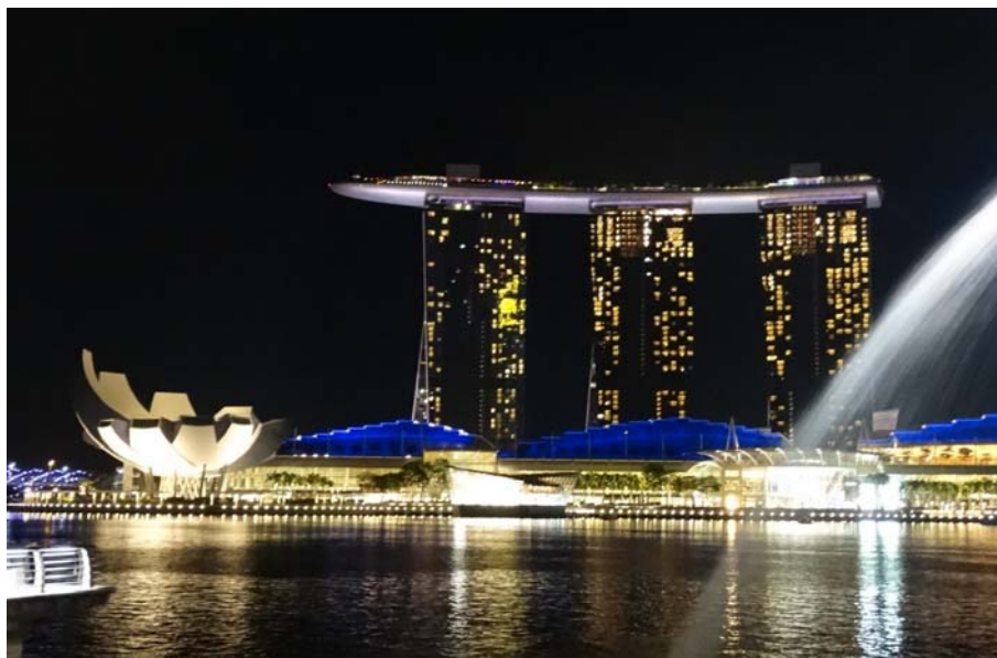
Fig. 3. Properly arranged external space generates a positive influence on the state of our mind - it raises the mood, arouses positive aesthetic impression, calms (Marina Bay, Singapore)

Ryc. 3. Odpowiednio zaaranżowana przestrzeń zewnętrzna wpływa pozytywnie na stan naszego umysłu – podnosi nastrój, budzi pozytywne wrażenia estetyczne, uspokaja (Marina Bay, Singapur).