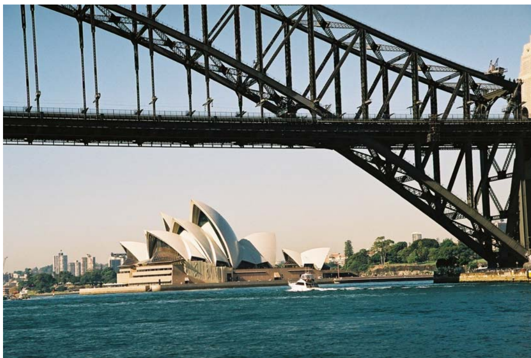
Fig. 1. Sydney Opera.

whole range of factors and its diversity constitute, first of all, as a result of personal qualities surrounded by social, aesthetic and cultural values (Fig. 1). Stimuli generated by the exterior environment shape the personal memory, as well as way of response. Response to stimuli is mediated by cortisol, includes regulation of physiological processes in the hippocampus, amygdala, and prefrontal cortex, which are responsible for reactions that result in behavioural response: fright, flight, and fight, together with wide physiological response. [2][8][14][15][19]