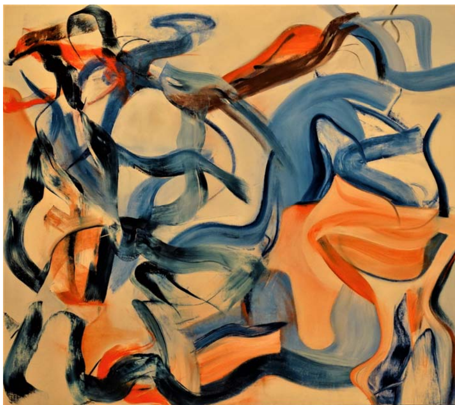
Fig. 5. Willem de Kooning „Untitled XXI” , Philadelphia Museum of Art. Ryc. 5. Willem de Kooning „Untitled XXI” , Philadelphia Museum of Art.

One of the artists who suffered from dementia was Willem de Kooning, an American painter of Dutch descent, a representative of abstract expressionism (1904-1997). The artist had been diagnosed with memory impairment since 1980, ie from 76 years ago, and diagnosed with Alzheimer's disease in 1989. The artist was creating until the last moments of his life. Because of his condition, the character of his paintings changed completely – they became much more abstract (Fig. 5). We call it "dementia syndrome" (C.H. Espinel). Today, his works, both before and after illness, can be admired at the Philadelphia Museum of Art, United States. Interestingly, the images produced during the disease reached a much higher price at auctions than before the onset of dementia. [3][4][5]