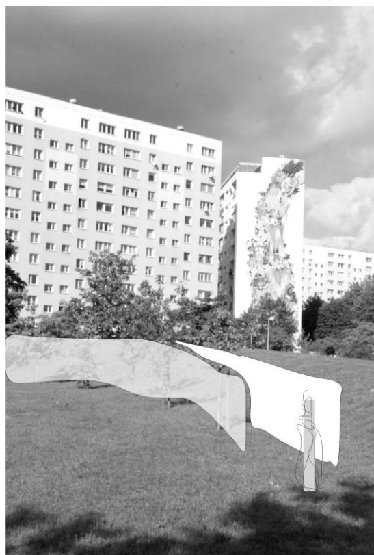
Fig. 3. Sketch to the 'shelter' project prepared for the 'Images Painted with Fire' Artistic Festival scheduled for October 2016 in the Zaspá district of Gdańsk. Source: illustration by A. Kurkowska

Ryc. 3. Szkic do projektu 'schronienie' przygotowany na Festiwal Artystyczny 'Obrazy Ogniem Malowane' planowany na październik 2016 w gdańskiej dzielnicy Zaspá. Źródło: il. A. Kurkowska