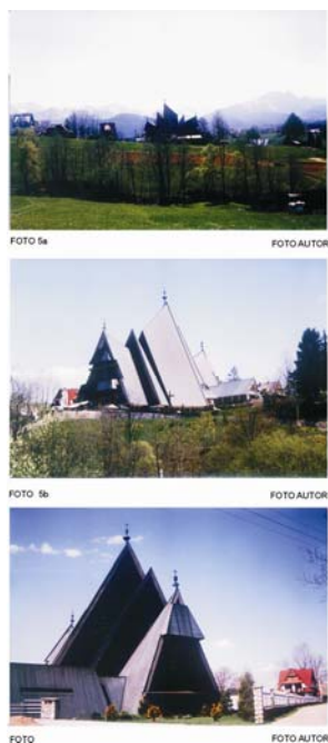
Ryc. 1. Dokumentacja fotograficzna.

Fig. 1. Photographic documentation.