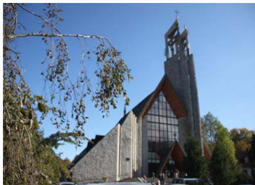
Ryc. 11. Współczesny budynek sakralny w Zakopanem, ul. Zamoyskiego.

Fig. 10. Boarding house in Zakopane style in Zakopane, Krupówki street.