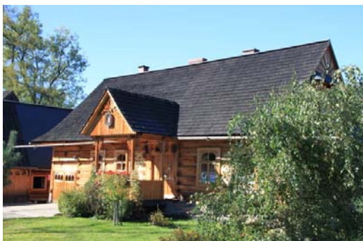
Ryc. 3. Tradycyjny budynek mieszkalny w Zakopanem, ul. Kościeliska.

Fig. 3. Traditional residential building in Zakopane, Kościeliska street.