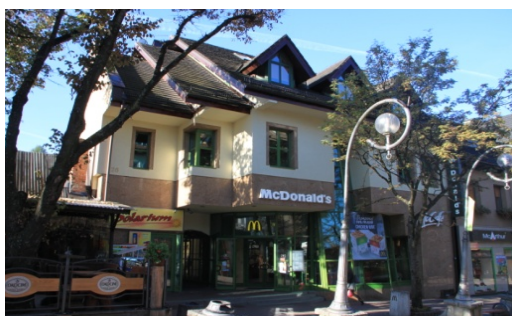
Ryc. 14. Współczesny budynek handlowy w Zakopanem, ul. Krupówki – poszukiwanie nowej formy.

Fig. 13. Contemporary service building in Zakopane, – Krupówki street – combination of modernity with tradition.