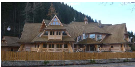
Ryc. 17. Współczesny budynek mieszkalny w Zakopanem, – Kościelisko – poszukiwanie współczesnych form budownictwa tradycyjnego.

Fig. 16. Contemporary residential building in Zakopane, Kościelisko – searching for modern forms of traditional building.