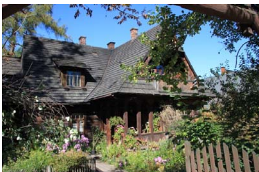
Ryc. 5. Budynek mieszkalny w stylu witkiewiczowskim w Zakopanem, ul. Kościeliska.

Fig. 4. „Koliba” – first house built in Zakopane style.