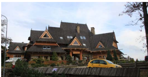
Ryc. 15. Współczesny budynek pensjonatowy w Zakopanem, Kościelisko – nawiązanie do tradycji.

Fig. 14. Modern commercial building in Zakopane, Krupówki street – searching for new forms.