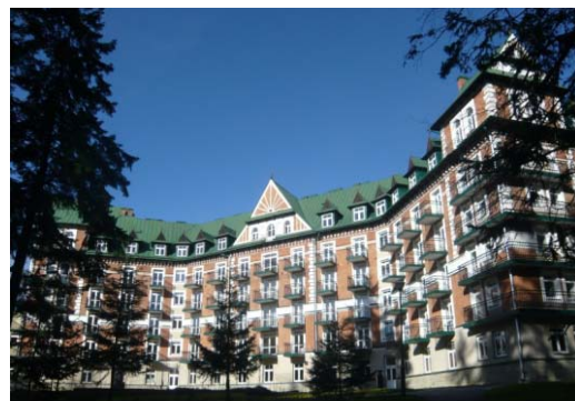
Ryc. 8. Budynek pensjonatowy nawiązujący do stylu witkiewiczowskiego w Zakopanem, Kościelisko.

Fig. 7. Service building referring to "Witkiewicz" style in Zakopane, Krupówki street.