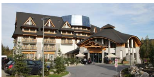
Ryc. 18. Współczesny budynek hotelowy w Zakopanem, Jaszczurówka – nawiązanie do tradycji, połączenie nowoczesności z tradycją.

Fig. 17. Contemporary residential building in Zakopane Kościelisko – searching for modern forms of traditional building.