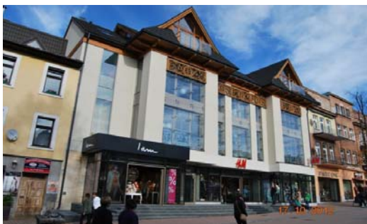
Ryc. 13. Współczesny budynek usługowy w Zakopanem, ul. Krupówki – połączenie nowoczesności z tradycją. Źródło: fot. autor

Fig. 13. Contemporary service building in Zakopane, – Krupówki street – combination of modernity with tradition. Source: author