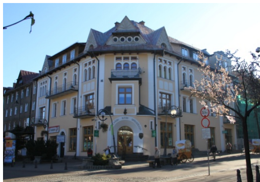
Ryc. 7. Budynek usługowy nawiązujący do stylu witkiewiczowskiego w Zakopanem, ul. Krupówki.

Fig. 7. Service building referring to "Witkiewicz" style in Zakopane, Krupówki street.