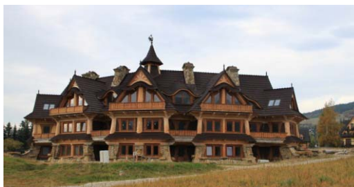
Ryc. 16. Współczesny budynek mieszkalny w Zakopanem, Kościelisko – poszukiwanie współczesnych form budownictwa tradycyjnego.

Fig. 15. Contemporary boarding house in Zakopane, Kościelisko – reference to tradition.