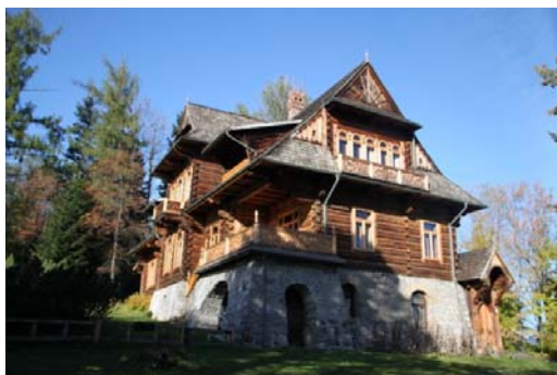
Ryc. 4. Pierwszy dom wybudowany w stylu zakopiańskim „Koliba”.

Fig. 3. Traditional residential building in Zakopane, Kościeliska street.