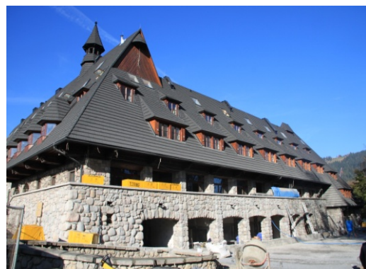
Ryc. 10. Budynek pensjonatowy w stylu zakopiańskim w Zakopanem, ul. Krupówki.

Fig. 9. Hotel building referring to "Witkiewicz" style in Zakopane, Krupówki street.