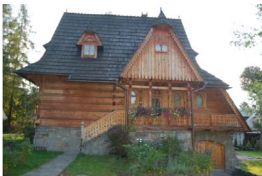
Ryc. 6. Współczesny budynek mieszkalny nawiązujący do stylu witkiewiczowskiego w Zakopanem.

Fig. 5. Residential building in „Witkiewicz” style in Zakopane, Kościeliska street.