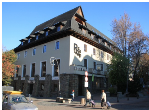
Ryc. 9. Budynek hotelowy nawiązujący do stylu witkiewiczowskiego w Zakopanem, ul. Krupówki.

Fig. 8. Boarding house referring to "Witkiewicz" style in Zakopane, Kościelisko.