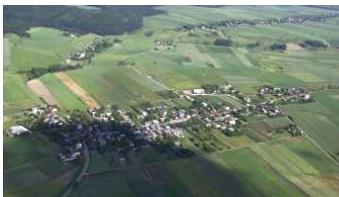
Fig. 2. Mokrus and Gulzów. The building development creates the most dense and most recognizable cluster-forms in this scenery.