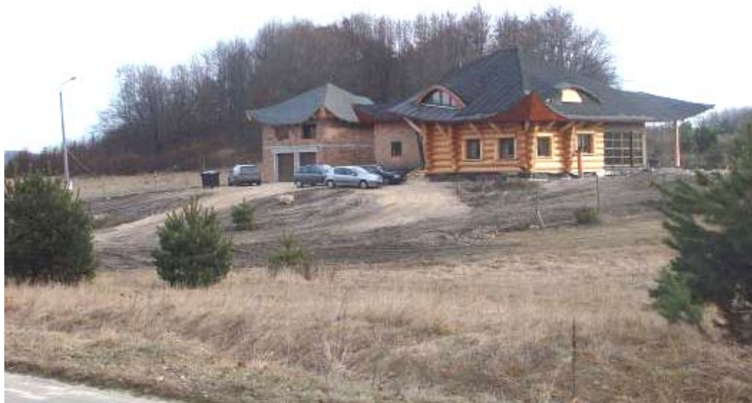
Ryc. 6. Sołectwo Ryczów. Kulturowo obca zabudowa powstaje w miejscu eksponowanym, u podnóża wapiennych ostańców. Źródło: Autor

Fig. 6. The culture-alien building development at the foot of the limestone crags. Source: Author.