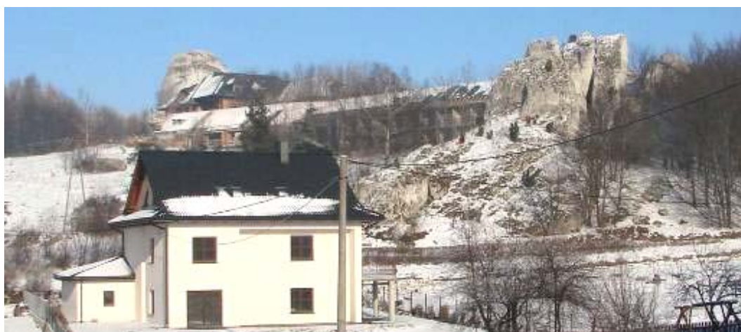
Ryc. 5. Sołectwo Podzamcze – najwyższy szczyt Góry Zamkowej (2011 r.). Rabunkowa eksploatacja wzgórza doprowadza do powstawania wciąż nowych inwestycji związanych z obsługą ruchu turystycznego. Fig. 5. Podzamcze – ill-suited architectural („usage”) of the Castle Hill project as newer and newer tourism-confined buildings.

kontynuują one tradycji budowlanej regionu i to zarówno w materiale – co jest zrozumiałe, ale i w bryle, często agresywnej, w większości nietypowej, obcej dla krajobrazu wsi tego regionu.