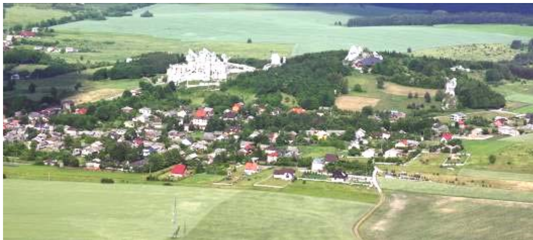
Ryc. 4. Sołectwo Podzamcze – wzgórze zamkowe, widok od str. zachodnio-południowej (2008 r.) Bezplanowe zadrzewienia ograniczają ekspozycję. Na najwyższym wzniesieniu, w miejscu budynku stacji przekaźnikowej - nowa inwestycja. Zabudowa jednorodzinna niepokojąco „wspina się” w kierunku wzgórza.

Jak widać, ilość opracowań planistycznych i konserwatorskich dotyczących tego jednego obszaru była imponująca. A jednak ... W dokumencie W.K.Z. znaleźć można stwierdzenie, że „poprzednie opracowania nie stanowią dokumentów wykorzystywanych w praktyce dnia codziennego”. Ogólne postulaty projektu były jednak zbieżne z poprzednimi opracowaniami i można się przekonać, iż także nie zostały wykorzystane w należytych stopniu.