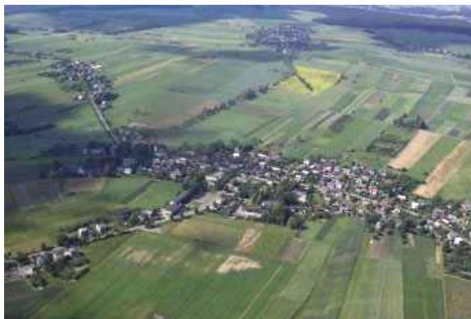
Ryc.2. Mokrus i Gulzów. Zabudowa tworzy najbardziej skupione i rozpoznawalne formy w krajobrazie.

Fig. 1. Giebło (under village administration office – Giebło). A village with traits of a planning system.