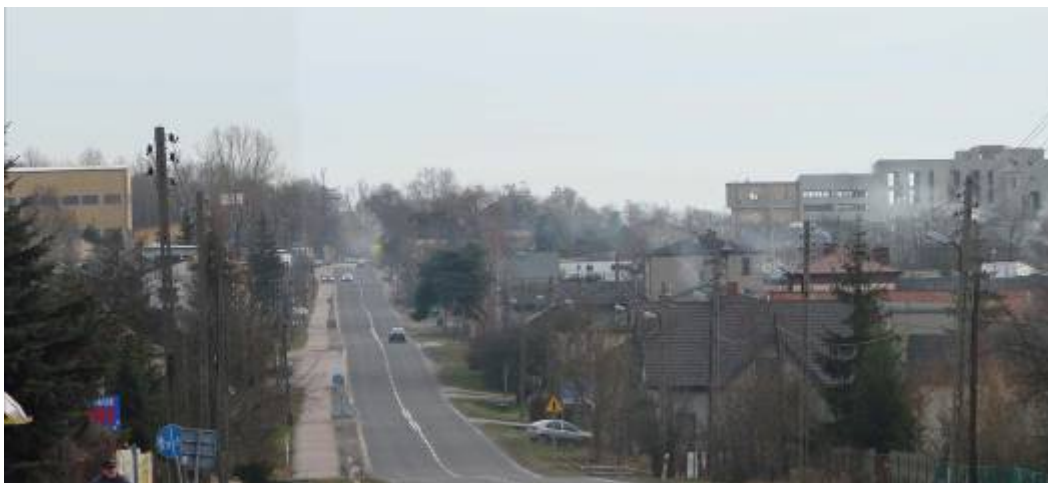
Ryc. 8. Sołectwo Fugasówka - wieś urbanizowana.