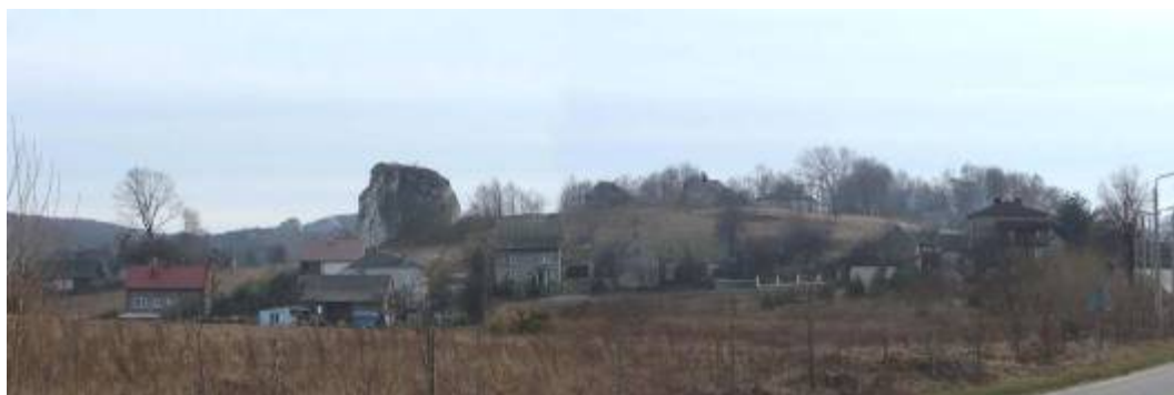
Ryc. 7. Sołectwo Ryczów. Rabunkowa eksploatacja, najatrakcyjniejszych pod względem krajobrazowym, terenów.

Fig. 6. The culture-alien building development at the foot of the limestone crags.